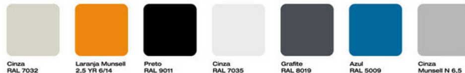
TABELA DE CORES